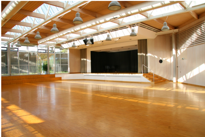
Saal mit Blick auf die Bühne