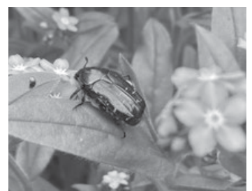
Der Goldglänzende Rosenkäfer auf Vergissmeinnicht

Der einfachste Weg, Wildbienen und anderen Insekten im eigenen Garten zu helfen, ist es, den Rasenmäher im Mai stehen zu lassen. Die Aktion „Mähfreier Mai“ kommt ursprünglich aus England und heißt dort „No Mow May“. Auch die Deutsche Gartenbau-Gesellschaft 1822 ermutigt Gartenbesitzer, im Mai eine Pause einzulegen. Für Bienen, Hummeln und Co. ist