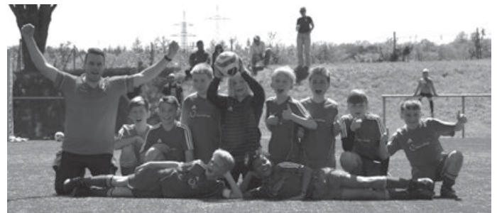
Die siegreichen roten Helden der E2 am 27.04.2024

So kann es weitergehen, kommende Woche geht es zur Spielvereinigung Hochdorf / Notzingen / Plochingen (U11). Mal sehen, ob sich das weitere Punkte holen lass