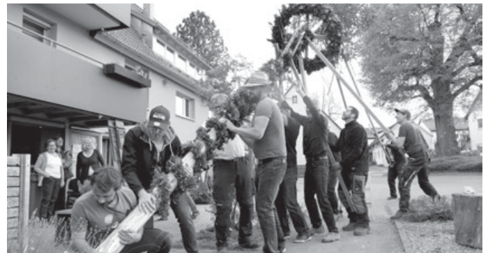
Die Maibaum-Aufstellmannschaft steht wieder bereit – bald ist's soweit!

Wir gratulieren dem Kulturverein Krummhardt ganz herzlich zum 25-Jahr-Jubiläum und zum gelungenen Geburtstagsfest. Scheewar's, vielen Dank, wir haben gerne und ausgiebig mit euch gefeiert. Und weil man in dieser Nachbarschaft so schön feiern kann, laden wir herzlich ein zum nächsten Festle in Krummhardt: dem traditionellen Maibaumfest des Krummhardter Dorflädles am Sonntag, 12.05.2024 , dem Muttertag! Man trifft sich ab 11.00 Uhr vor dem Krummhardter Dorfläde zum Maibaum bewundern, Maibock- oder Weizenbier oder Muttertags-Sekt probieren, dazu unseren legendären Schweinehals oder eine knackige Rote oder Aichelberger Wurst – was braucht's mehr? Ja klar, noch ein oder zwei herzhaftes Kräuterbrot und natürlich nachmittags einen tollen Kuchen von unserer Kuchentheke oder ein Eis. Dazwischen bietet sich eine Runde Boule an oder einfach nur sitzen, mit den Nachbarn schwätzen, noch ein Maibock probieren und den Tag genießen. Kommt mit Mama, Oma, Papa, Opa, Kindern und Enkeln, mit Freunden oder alleine (ihr bleibt's bestimmt nicht lang!). Wir freuen uns darauf, mit euch zu feiern.