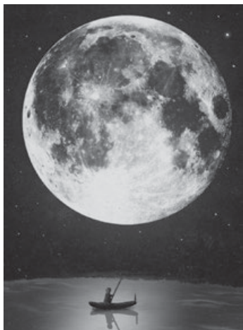
Der Mond – immer für eine Geschichte gut

Am Samstag, 9. November 2024, liest Vorlesepat Thomas Hasemann erstmals in der Bücherei Aichwald vor. Im ersten OG der Bücherei steht ab 11.00 Uhr der Mond im Mittelpunkt. Kinder ab 4 Jahren sind herzlich dazu eingeladen. Einfach vorbei kommen und sich überraschen lassen!