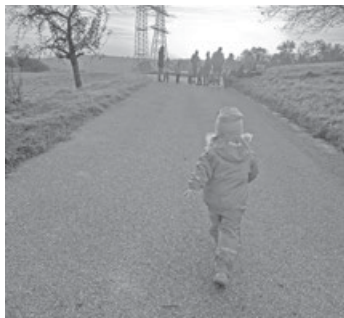
Ein neuer Morgen im Waldkindi.

„MAMAAAA!“ – ich stecke meinen Kopf zur Badezimmertür rein – „Du musst noch meine Zähne putzen, damit ich in den Kindi los kann!“. Schmunzelnd und etwas erstaunt putze ich ihr die Zähne. Danach hüpfte sie vom Hocker und läuft zur Wohnungstür. „AUFMACHEN MAMA!“ Vor der Tür zieht sie sich ihre Matschsachen für den Tag an. Jetzt wo es draußen unbeständiger wird, werden alle Kindisachen im Flur vor der Wohnung angezogen.