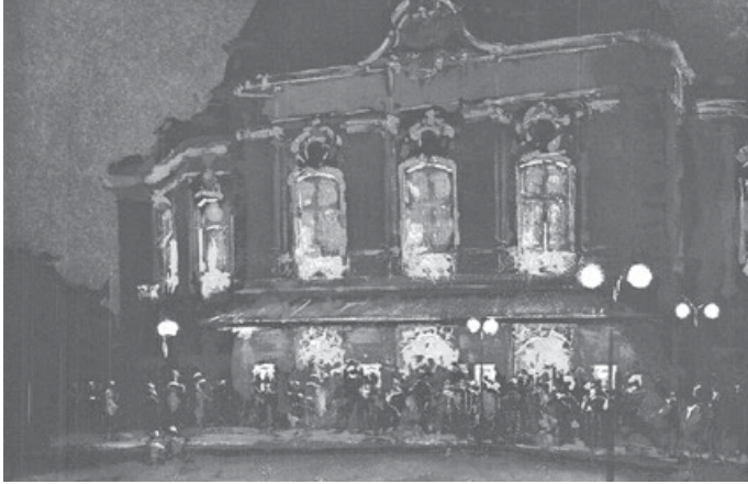
„Konzertpause“, Farbradierung von 2 Platten“ von Friedel Anderson.

Öffnungszeiten: jeweils samstags von 14.00 – 19.00 Uhr und sonntags von 11.00 – 18.30 Uhr.