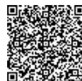
QR-Code zur Spendenaktion

Sie, liebe genannten und ungenannten Spenderinnen und Spender, tragen mit Ihrer großzügigen Spende wesentlich dazu bei, dass an der Jugendmusikschule Aichwald derzeit über 500 Kinder und Jugendliche einen fundierten und aktiven Zugang zur Musik erhalten, darunter auch alle Grundschul Kinder im Rahmen unseres Kooperationsprojekts „Singende Grundschule Aichwald“.