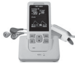
Unser neues Pulsoxymete

kann, wurde durch ein neues Gerät ersetzt. Dieses neue und rund 400.- Euro teure Kompakt-Gerät ist mit einem Farbmonitor ausgestattet und kann zusätzlich zum Puls auch die Atemfrequenz messen. Neu ist, dass das Gerät über ein 3-Kanal EKG verfügt. Somit besteht nun die Möglichkeit, dass der Helfer vor Ort schnell und sicher ent-