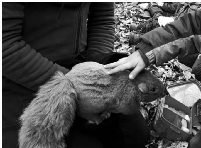
Kuschel das Eichhörnchen

Bilder und Infos zum Aichhörnchen Waldkindergarten e.V. finden Sie unter www.aichhoernchen-waldkindergarten.de .