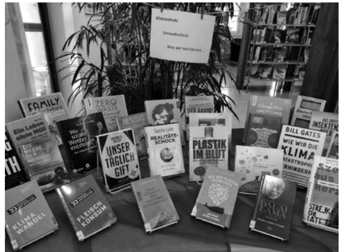
Anregungen und Tipps zum Thema Klima- und Umweltschutz im OG der Bücherei

Der Klima- und Umweltschutz drängt sich immer mehr in das öffentliche Bewusstsein. Was die Klimaveränderung anrichten kann, war im Laufe der letzten Jahre immer wieder zu bestaunen. Dass es so nicht weiter gehen kann, wird immer deutlicher. Doch was können wir dagegen tun? Ganz praktische und konkrete Hinweise und Tipps gibt die aktuelle Ausstellung im OG der Bücherei Aichwald – kommen Sie vorbei und holen Sie sich Anregungen.