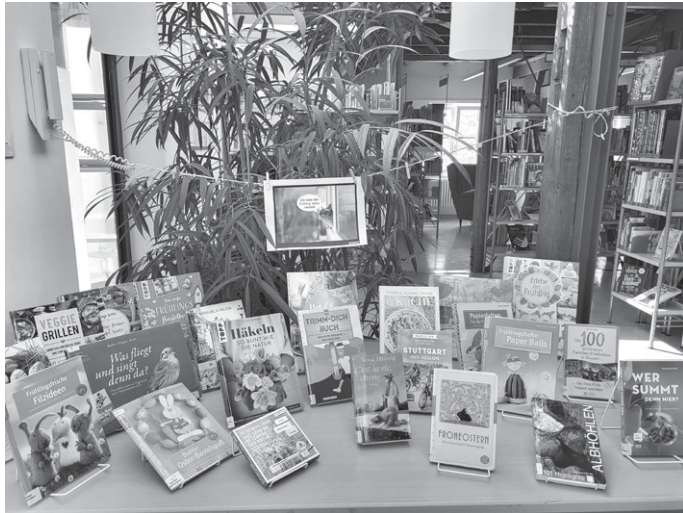
Lassen Sie sich inspirieren, was im Frühling alles möglich ist!

... heißt es in der neuen Ausstellung im OG der Bücherei Aichwald. Sie erhalten Anregungen, was Sie alles im Frühling unternehmen können – ob Rezepte fürs Grillen, Ausflüge in die nähere Umgebung, basteln für Ostern – da ist für jeden etwas dabei!