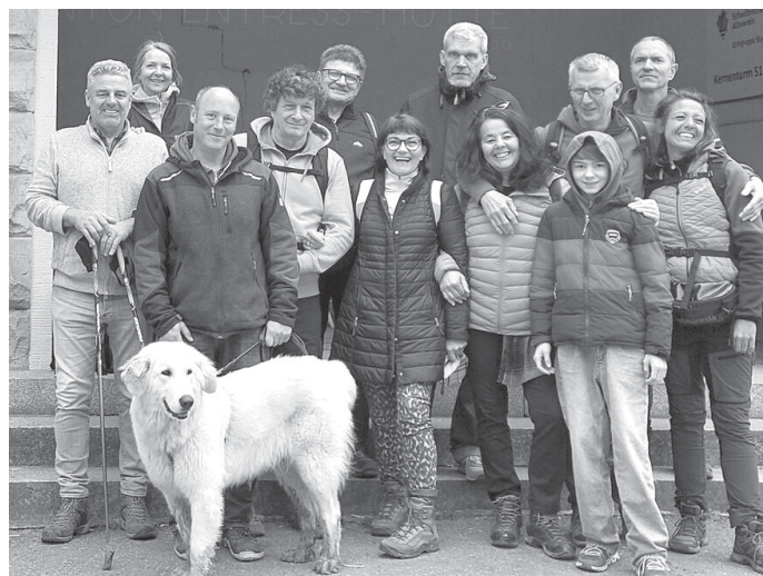
Vor dem Aufstieg am Kernenturm