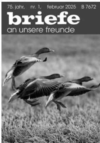
Zeitschrift „briefe an unsere freunde“