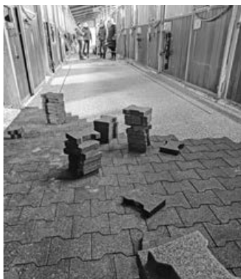
Neue Steine in der Stallgasse sorgen für einen besseren Grip

Die alten Knochensteine in unserer Stallgasse haben sich im Laufe der Jahre stark abgenutzt, so dass die Pferde mit ihren Hufeisen darauf ausgerutscht sind. Deshalb haben wir einen neuen Boden aus Gummisteinen eingebaut. Dieser bietet nicht nur einen besseren Halt, sondern auch ein angenehmeres Laufgefühl für unsere vierbeinigen Freunde. Ein herzliches Dankeschön an alle engagierten Mitglieder, die den Umbau tatkräftig unterstützt haben.