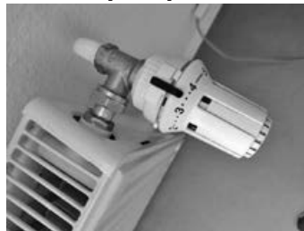
Wie heizen wir zukunftssicher?

Wie effektiv sind Wärmepumpen in älteren Häusern? Welche Voraussetzungen müssen erfüllt sein? Diese Frage beschäftigt viele Hausbesitzer, die ihre Immobilien zukunftssicher beheizen möchten. Um diese Fragen zu beantworten, besuchen wir zwei Familien in Aichwald-Aichelberg, die in ihren Bestandsgebäuden