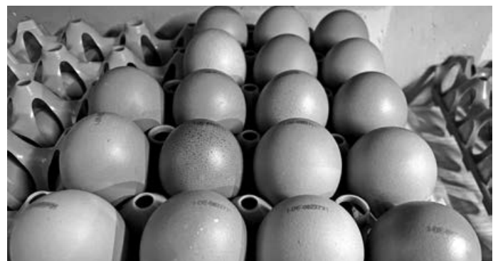
Unsre adlige Eier