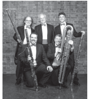
SWR Swing Fagottett

Der Vorverkauf hat begonnen: Rathaus Aichwald / Ben's Schreibwaren / Blumen Dilger / Tankstelle Aichschieß / Tourist-Info im Bahnhof Endersbach VVK: 13 Euro / AK: 15 Euro / ermäßigt: 7 Euro