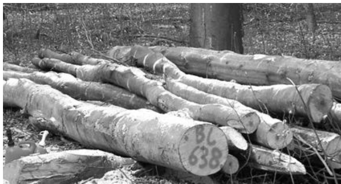
Ab sofort kann Brennholz beim Kreisforstamt Esslingen über einen digitalen Einkaufskorb erworben werden.

Der Brennholzverkauf des Kreisforstamtes Esslingen wird digital. Der sogenannte „Holzfinder“ ist eine Ergänzung zu den bisherigen Möglichkeiten Brennholz zu kaufen. Ab sofort können sich die Brennholzkundinnen und -kunden in dem Portal à www.holzfinder.de über das aktuelle Brennholzangebot in ihrer Umgebung informieren und auch bisher noch nicht verkaufte Holzpolter aus dem Gemeindefeld des Jahres 2024, in den digitalen Einkaufskorb legen.