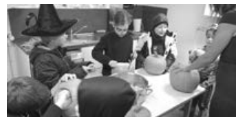
Alle Hände voll zu tun – beim Kürbisschnitzen, Foto: NaturFreunde Weinstadt e.V.

Am Nachmittag des Geisterfestes (31.10.2024) waren die Kinder der IGEL Gruppe zu einem weiteren Treffen am NaturFreundehaus eingeladen. Das Motto lautete: Kürbisse & Gruselparty. Pünktlich erschienen alle in ihrem persönlichen Grusel-Outfit – Hexe, Magier, Skelette, aber auch Hulk war mit dabei. Die Begrüßung erfolgte in der bereits mit Kürbissen vorbereiteten Stuhlrunde. Danach suchte sich jedes Kind seinen eigenen Kürbis aus.