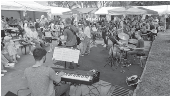
„Government“: Die neue Band der Jugendmusikschule

Das Sommerfest des Musikvereins Aichschieß e.V. war auch in diesem Jahr wieder ein voller Erfolg und stand das ganze Wochenende über unter dem Zeichen des gemeinsamen Musizierens.