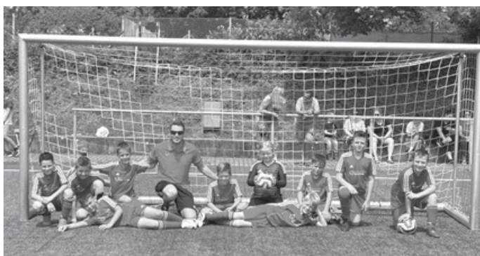
E2 beim Heimspiel am 07.06.2024