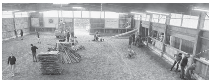
Viele fleißige Helfer beim Bau der neuen Reithallenbande

In einem zweitägigen Arbeitseinsatz haben wir in Eigenregie die Bande der Reithalle erneuert. Dazu musste zuerst die alte Bande inkl. dem Holzunterbau abgerissen und das Betonfundament freigelegt werden. Anschließend wurde die neue Bande eingebaut. Hier waren Können, Präzision und handwerkliches Geschick gefragt. Es wurde gesägt und gebohrt. Auch die drei Zugänge/Tore zur Reithalle wurden in diesem Zuge erneuert. Das Bewirtungsteam sorgte für eine köstliche Verpflegung rund um den Tag und Abends wurde zusammen gegrillt. Wir möchten uns ganz herzlich bei allen fleißigen und engagierten Helfern bedanken! Ein ganz besonderer Dank geht an alle Nicht-Mitglieder (Papas, Freunde und Bekannte), die uns so toll unterstützt haben. Ohne euch hätten wir das nicht geschafft! Ein riesengroßes Dankeschön – ihr seid spitze!