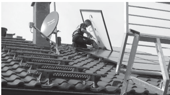
Drei Montageteams bringen die PV-Module auf den Dächern in Aichwald und Lichtenwald an.

Weitere Informationen unter: https://teckwerke-buergerenergie.de/