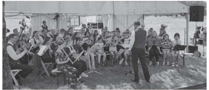
Die Bläserinnen der Jugendmusikschule beim gemeinsamen Auftritt mit der Stammkapelle