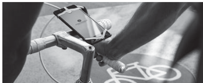
Stadtradeln: © Klima_Bündnis

Wählen Sie sich ein bei „Stadtradeln“. Dort sind alle Informationen einzusehen, wählen Sie sich bei der Kommune „Aichwald“ ein, registrieren Sie sich und treten dem Team „Kirchenradler“ bei. In den letzten Jahren war das Team „Kirchenradler“ mehrfach das Team mit den meisten gefahrenen Kilometern. Auch 2024 streben wir dies an. Wir freuen uns, wenn Sie sich anschließen.