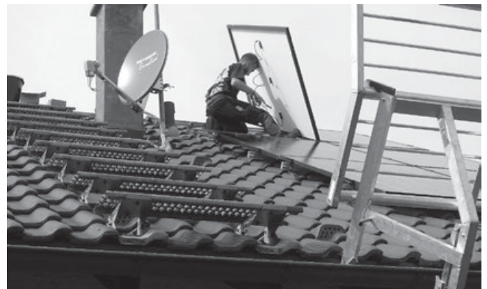
Drei Montageteams bringen die PV-Module auf den Dächern in Aichwald und Lichtenwald an.