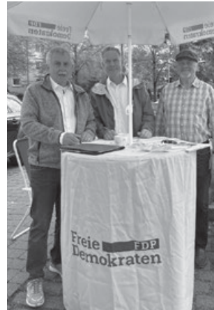
Dialog am Markttag

Liebe Bürgerinnen und liebe Bürger, der FDP-Ortsverband Schurwald lädt ein zum Bürgerdialog am Markttag in Aichwald-Schanbach, Freitag, 7. Juni 2024 ab 14.00 Uhr. Passend zum Markt stehen unsere Mitglieder und Gäste mit unserem gelben Schirm da, um bei fast jedem Wetter mit Ihnen über politische Themen ins Gespräch zu kommen. Besuchen Sie gerne unsere Homepage www.fdp-schurwald.de