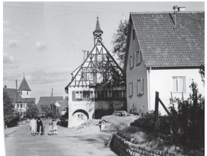
Seit 1994 hat die Sozialstation Schurwald ihren Sitz im alten Aichschießer Rathaus

„Der Zusammenschluss von Aichelberg, Aichschieß und Schanbach zur Gemeinde Aichwald ist eine echte Erfolgsgeschichte“, so Bürgermeister Andreas Jarolim. „Damit wurde vor 50 Jahren der Grundstein gelegt für den wichtigen Ausbau und die Modernisierung der kommunalen Einrichtungen – und damit für die hohe Lebensqualität und den unvergleichbaren Zusammenhalt der Menschen in unserer Gemeinde.“