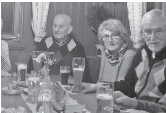
In froher Gemeinschaft

Wegen der Feiertage wollen wir unseren Stammtisch schon am Donnerstag 21. März ab 19.00 Uhr abhalten. Wir freuen uns wenn wir uns in der Linde in Aichschieß treffen können. Jedermann/frau ist herzlich eingeladen. Euer A.K.