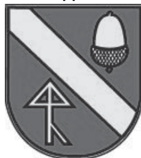
Wappen der Gemeinde Aichwald

Im Zuge der Gemeindereform in Baden-Württemberg lag die Verantwortung für die Vergabe der neuen Ortsnamen ebenfalls bei den beteiligten Gemeinden. Bereits 1972 hatten die Gemeinderäte von Aichelberg, Aichschieß und Krummhardt den Vereinbarungen für einen Zusammenschluss zugestimmt, der zum 1. Januar 1974 in Kraft treten sollte. Auch der neue Name sollte die Zusammenführung der drei Orte symbolisieren und zu-