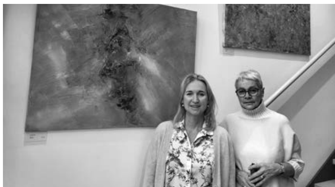
2024 waren Bilder des Kunststellers Neuffen in der Bücherei zu sehen

Bei Interesse melden Sie sich einfach unter Tel. 07 11 / 3 05 19 33 in der Bücherei Aichwald, Ansprechpartnerin ist Anita Andler.