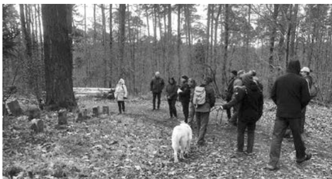
Halt am Hundefriedhof

Andreas Dimter, Presse- & Öffentlichkeitsarbeit