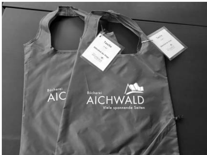
Das sind die praktischen Taschen zum Ausleihen (Bücherei Aichwald)

zurückgeben. Sie wird ganz normal verbucht und steht damit auch in Ihrem Konto drin, so dass sie auch nicht vergessen werden kann. Oder wenn Sie sie ganz praktisch finden können Sie eine der blauen Taschen mit Bücherei-Logo auch für 2 € erwerben.