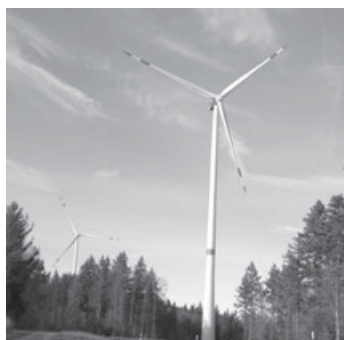
Windräder am Goldboden bei Winterbach

– Aufgrund der großen Nachfrage wiederholen wir dieses Angebot. –