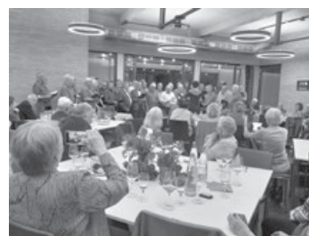
Der vereinte Männerchor

Vor Kurzem haben wir die Einladung des Weingärtner Liederkranzes zu einer musikalischen Weinprobe erhalten. Der Einladung sind wir gerne gefolgt und so ging es Samstag abends nach Mettingen. Die Probe fand in den neu gestalteten Räumen des Teamwerk Esslingen statt.