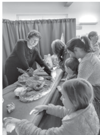
Nach der Aufführung konnten sich die Besucher die Bühne ganz genau ansehen