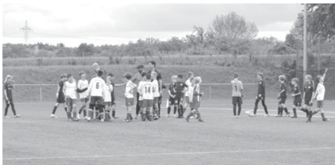
STARKE ERSTE HALBZEIT...nächstes Mal geht mehr!!!

Die Partie endet zugunsten des VFB, aber was unsere Jungs in der ersten Halbzeit gezeigt haben macht Mut und stimmt uns Fans zuversichtlich.