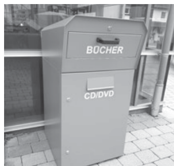
Immer geöffnet: die Rückgabebox der Bücherei

Ist Ihnen das auch schon mal passiert: eine längere Reise steht bevor und kurz vor Antritt stellt man fest, die Büchereimedien sind überfällig und die Bücherei hat aber schon zu? Kein Problem – denn die Rückgabebox der Bücherei hat rund um die Uhr geöffnet. Einfach Bücher, Spiele, CDs und DVDs einwerfen und am nächsten Öffnungstag wird vom Büchereiteam alles zurück gebucht.