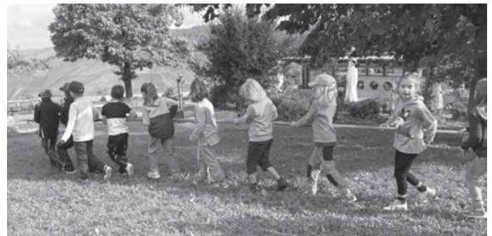
Transport der langen Hakenstange

Sechs Wochen nach dem „Indianer-Tag“, am 30. September 2023, lösten die NaturFreunde ihr Versprechen auf eine Fortsetzung des Sommerferienprogrammes ein. Pünktlich um 9.30 Uhr waren alle 10 Kinder am NaturFreundehaus angekommen und es erfolgte eine Begrüßung im bekannten Sitzkreis auf der Waldbühne. Ab jetzt stand das Thema „Apfel“ im Mittelpunkt.