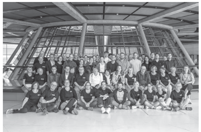
An ihren T-Shirts sollt ihr sie erkennen – Gruppenbild mit allen