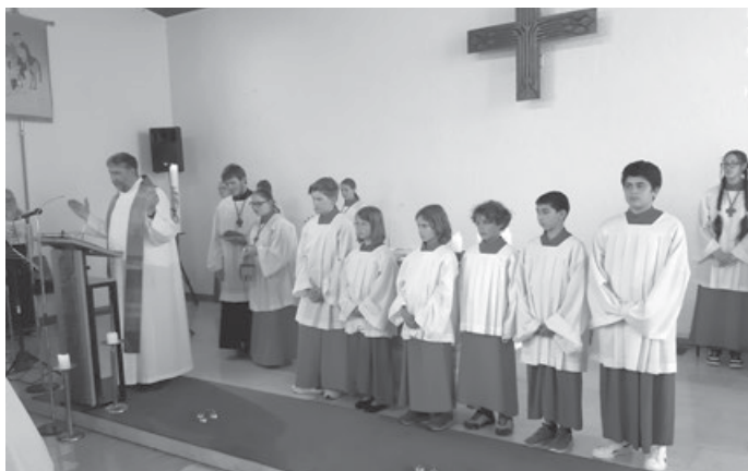
Aufnahme von sieben neuen Ministranten

50 Jahre St. Martin Aichelberg – „Kultur teilen“ im Kirchenkabarett mit Bruder Theo am Freitag, 22. September 2023 um 19.30 Uhr wird anlässlich des 50-jährigen Kirchenjubiläums der kath. Kirche St. Martin in Aichelberg „Kultur geteilt“ – „Bruder Theo“ kommt zu Besuch! Sichern Sie sich eine der limitierten Eintrittskarten, welche Sie für 10,- €, inkl. Pausengetränk und Imbiss, im Vorverkauf erhalten im kath. Pfarrbüro Waldstr. 27, Baltmannsweiler, in Aichelberg in der Blumenwerkstatt Dilger und in Schanbach bei Schreibwaren Ben's.