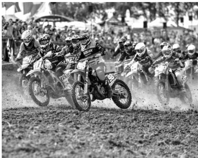
Fünf Deutsche Meisterschaften und der Ladies Cup sind in Aichwald am Start

Deutsche Jugend-Motocross-Meisterschaft 65 ccm: Volkswagen R, Wolfsburg