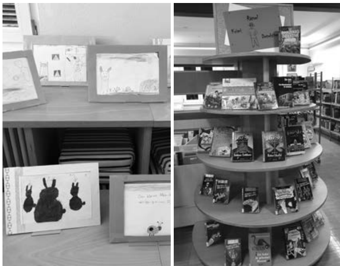
Kamishibai-Bilder der Kombiklasse aus Aichschieß

Elke Riethmüller, Lehrerin der Kombiklasse 1/2 aus Aichschieß stellte während der Osterzeit folgende Aufgabe: in Kleingruppen sollten die Kinder sich eine Geschichte ausdenken und diese im Kamishibai-Format als Bildergeschichte darstellen. Herausgekommen sind viele tolle Bilder, die nun in der Bücherei Aichwald ausgestellt sind. Weitere Kamishibai-Geschichten und auch die passende Holzbühne dazu können in der Bücherei auch entliehen werden.