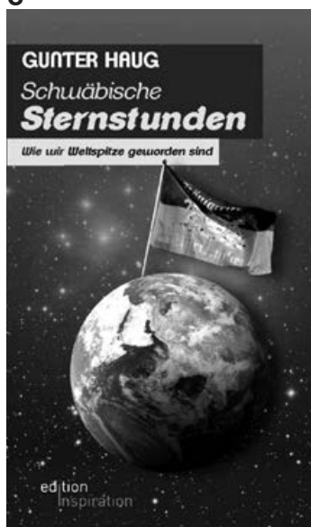
Das Cover der Buches, über das Gunter Haug im Juli in der Bücherei spricht

Und: was ist dran an der Behauptung, dass der Ottomotor gar nicht von Otto erfunden worden ist, sondern erst von Wilhelm Maybach zum Laufen gebracht worden ist?