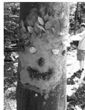
Kunstwerk aus Lehm

Beim Sommerfest des Waldkindergartens haben sich die Erzieherinnen wieder etwas ganz Besonderes einfallen lassen. Der Wald wurde zum Atelier. Die Kinder und Erwachsenen konnten an 4 Stationen ihrer Kreativität freien Lauf lassen. An einer Station entstanden lustige Lehmgesichter, die auf Baumstämmen modelliert wurden. An einer anderen Station wurde ein kunstvoll umzäunter und zum Spiel einladender Zaubergarten gestaltet. Bei der nächsten Station wurden die Teilnehmer zu Dinosaurier-Forschern. Mit Kalkfarbe wurden Äste bemalt und damit Saurierskelette gelegt. Eine bunte Sandschlange, die sich auf dem Waldboden entlangschlangelte, war das eindruckliche Ergebnis der vierten Station. In ruhiger, konzentrierter Atmosphäre waren diese einzigartigen Kunstwerke entstanden und wurden später bei einem gemeinsamen