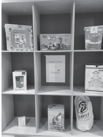
Ab den Novemberlichtern erstmalig ausleihbar: Gegenstände aus der Bibliothek der Dinge

Wie im letzten Jahr beteiligt sich die Bücherei Aichwald am Samstag, 25. November 2023 an den Novemberlichtern des BDS Aichwald – allerdings zu etwas anderen Zeiten. Bereits 15.00 Uhr öffnet die Bücherei ihre Türen und lädt bis 18.00 Uhr zu Kaffee und Kuchen ein. Dabei kann ein Bücherei-Quiz ausgefüllt und die mit Liebe gemachten Leseknochen von Nele Scholz bestaunt und erworben werden. Im Untergeschoss ist erneut der Medienflohmarkt aufgebaut – zunächst nur mit gut erhaltenen Romanen aus Schenkungen, die für 1 € verkauft werden. Im roten Regal wartet zudem die „Bibliothek der Dinge“ auf Ausleiher.