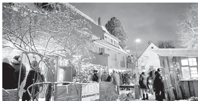
Lichterglanz vor dem Lädle

So schön war's letztes Jahr – unser erstes Lichterglanz-Festle vor dem Krummhardter Dorfläde. Wer erinnert sich nicht an die traumhaft beleuchtete Winterkulisse im Zentrum von Krummhardt? Das machen wir dieses Jahr wieder! Wir laden herzlich ein zum Lichterglanz , dem Festle vor Weihnachten, am Freitag 15. und Samstag 16.12. , jeweils ab 17.00 Uhr. Man trifft sich bei Feuer- und Kerzenschein vor dem Lädle zum Glühwein, Feuerzangenbowle, Bier/Sekt/Punsch trinken, Rote oder Raclettebrötle essen, schwätzen und entspannen vom Vorweihnachtstrubel. Natürlich hoffen wir wieder auf ein tolles Winterwunder. Aber gefeiert und traumhaft beleuchtet wird bei jedem Wetter. Unsere nagelneuen Wärmetonnen stehen bereit, so wird's richtig kuschlig draußen. Wir freuen uns auf euch. P.S. Unseren Mitgliedern geben wir wieder einen aus. Gutscheine für Essen und Getränke wurden bereits an alle verteilt. G.M.