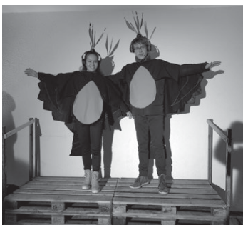
Gottesdienst an Heilig-Abend 2022

Auf dem Schulhof in Schanbach findet am 24.12. um 16 Uhr ein Gottesdienst für Kinder und Erwachsene statt.