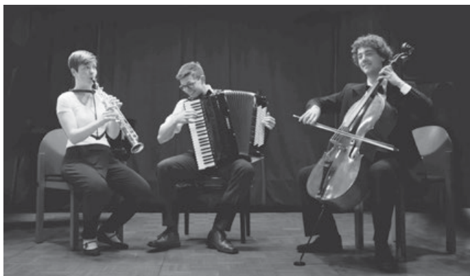
Trio Zügelnder Saitenwind

Mit ihren zahlreichen Konzerten haben sich die drei Musiker in Würzburg und Umgebung einen Namen gemacht und erhielten 2018 den Förderpreis für Musik des Lions Club de Leone. Als Stipendiaten des gemeinnützigen Vereins Yehudi Menuin Live Music Now Franken begeistern sie mit ihrer Musik außerdem in Behindertenwerkstätten, Förderschulen und Strafanstalten.