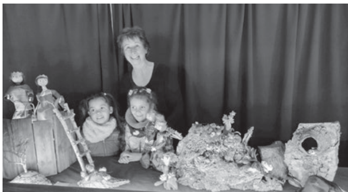
Die beiden Mädchen bewunderten das Bühnenbild und die Puppen ganz aus der Nähe