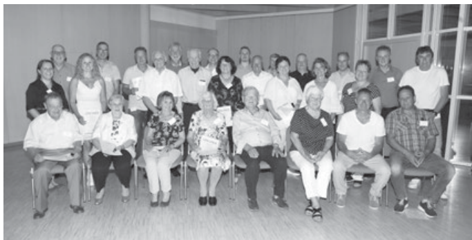
Jubilare der Jahre 2021 und 2022

Im Anschluss zum offiziellen Programm lud der ASV Aichwald und seine Jubiläumspartner, die Volksbank Mittlerer Neckar, zu einem „come together“ bei Schnittchen und Kaltgetränken ein. In lockerer Atmosphäre und angeregten Gesprächen ließen die Besucher den Abend noch einmal Revue passieren und in Erinnerungen schwelgen.