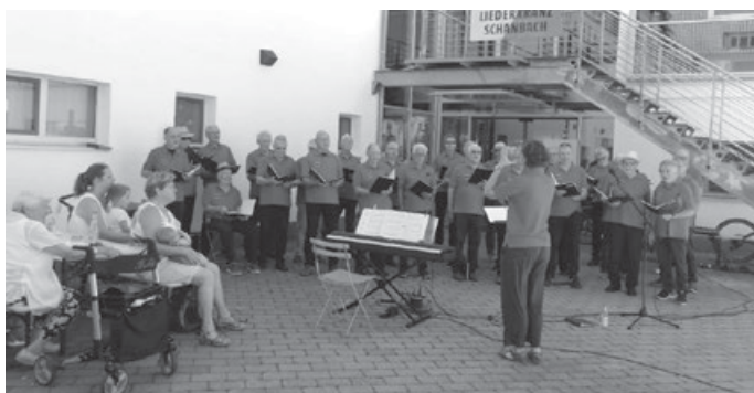
Liederkrantz Schanbach bei Remstal singt