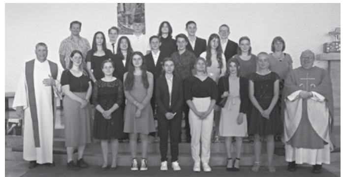
Feier der Firmung