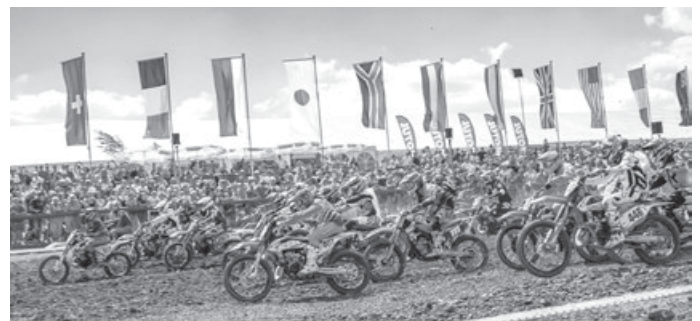
Viel los in Aichwald: Am Samstag und am Sonntag starten jeweils sechs Rennen!