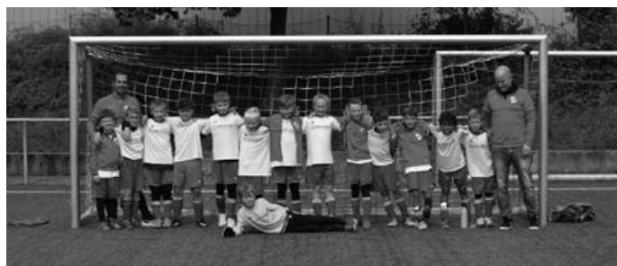
Das E-Jugend Team des ASV mit den beiden Trainern

Samstag 17.09.2022, 11.30 Uhr, leicht bewölkt, die E-Jugend des ASV Aichwald trifft sich zu Ihrem ersten Qualifikationsspiel in der E-Jugend. Zum Aufwärmen setzt Regen ein, der aber dann bereits in der ersten Halbzeit weniger wird und dann sogar ganz aufhört. Es wird alles etwas formaler...anders als seither dürfen nun alle Spieler nebeneinander und hinter dem Schiedsrichter auf den Platz laufen. Nach dem Anpfiff geht es recht schnell und der ASV kommt über