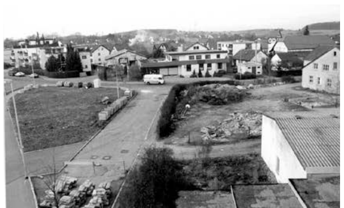
Seit Mitte der 80er Jahren hat sich das Ortsbild von Schanbach stark verändert.