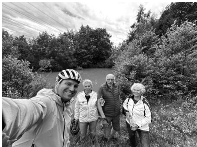
Feierabend-Radrunde am 11.06.2024

Alle Informationen und die Spielregeln finden Sie unter www.aichwald.de/stadtradeln .