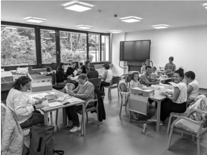
Ein Briefbogen nach dem anderen... Mit Spaß und Fleiß ging es hier ans Werk!

Ein riesengroßes und herzliches Dankeschön an alle, die uns so tatkräftig und mit so viel guter Laune und Engagement unterstützt haben!