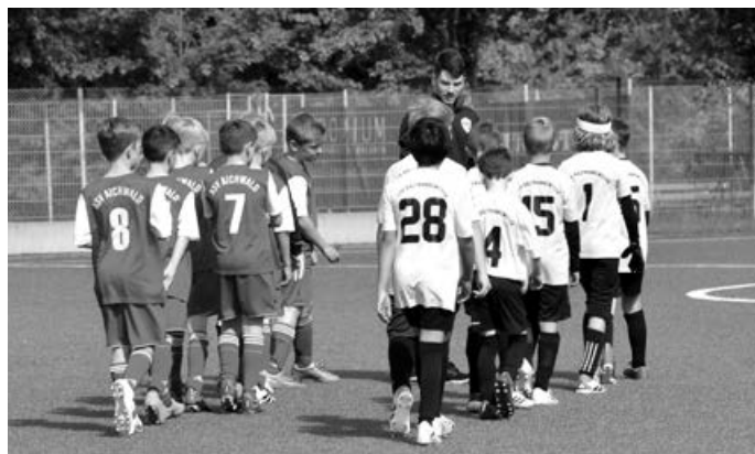
E2 beim Schurwald-Nachbarn in „Balte“

Aber das letzte Spiel kommt ja noch. Heimspiel gegen den Vorletzten...das wird klargemacht, auf jeden Fall versucht