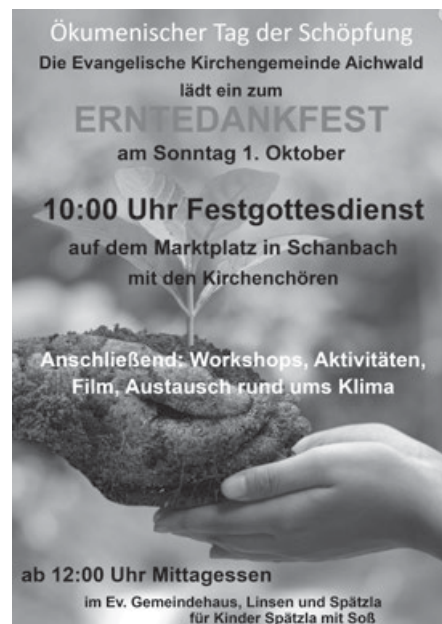
Erntedankfest KG Aichwald