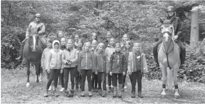
Strahlende Gesichter beim Reitlager.

beliebte Reitlager statt. Eine Woche lang durften 12 Kinder die Ferienzeit im Stall bei den Pferden verbringen. Es fanden jeden Tag Longenreitstunden statt, außerdem gab es geführte Ausritte und Reitstunden. Die Kinder übten den Umgang mit dem Pferd, z. B. mit Bodenarbeit oder bei einem Putzwettbewerb, bei dem die Pferde mit Perlen, Federn und Blumen wunderschön geschmückt wurden. Außerdem fand eine Schnitzeljagd statt und es gab Bastel-Aktivitäten. Das Küchenteam zauberte jeden Mittag ein leckeres Essen und im Anschluss fand Theorieunterricht statt. Am Ende der Woche wurde zum Abschluss eine kleine Vorführung für die Eltern inszeniert, bei der die Kinder zeigen konnten, was sie in der Woche gelernt haben. Ein schöner Abschluss für eine tolle Pferdewoche! Wir möchten uns an dieser Stelle ganz herzlich beim Organisationsteam und bei den vielen Helfern für ihre tolle Arbeit bedanken!